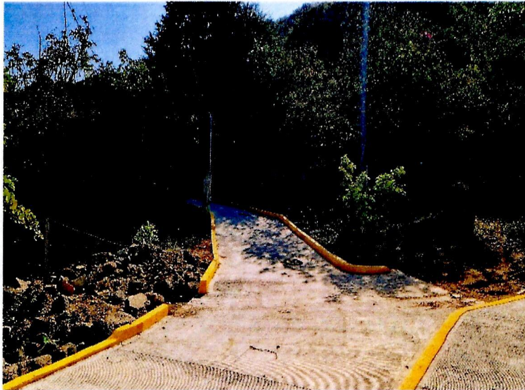
Concepto de obra ejecutado:

Municipio: ACTOPAN Localidad: LOS OTATES Ejercicio fiscal: EJERCICIO 2025 No. de obra: 2025300040010 Periodo: NOVIEMBRE Número de estimación: 1 FINIQUITO Descripción: CONSTRUCCIÓN DE PAVIMENTACIÓN DE CONCRETO HIDRAULICO EN CALLE VICENTE GUERRERO Fuente de financiamiento: FAISMUN Fecha de revisión: 16/12/2025